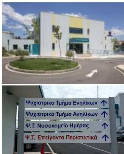
Εικόνα 1. ΤΟ ΝΕΟ ΨΥΧΙΑΤΡΙΚΟ ΤΜΗΜΑ ΤΟΥ ΝΟΣΟΚΟΜΕΙΟΥ ΤΡΙΠΟΛΗΣ